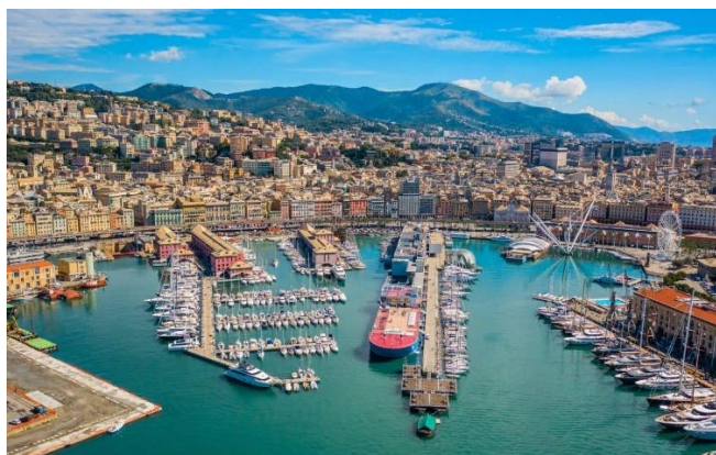
LE PORT DE GENES

Une expérience exceptionnelle pour ce groupe de « jeunes tarnais » qui vont découvrir les bienfaits de l'Union européenne dont la devise est « Unie dans la diversité » !