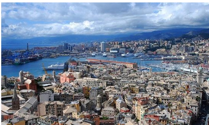
LA VILLE DE GENES

Cette expérience professionnelle en Italie co-organisée par la Mission Locale Tarn Sud et la Mission Jeunes Tarn Nord, est possible grâce à l'accompagnement à Gênes de l'Association VIRAMONDE.